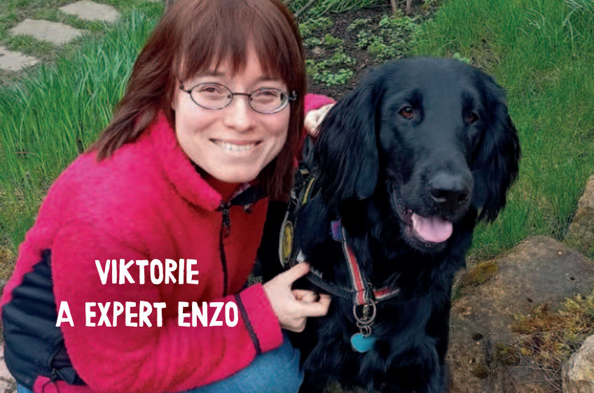
VIKTORIE A EXPERT ENZO