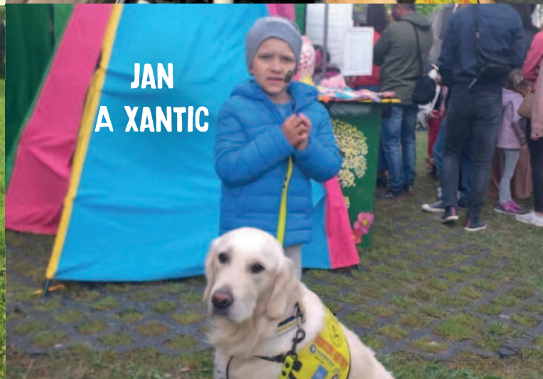
JAN A XANTIC