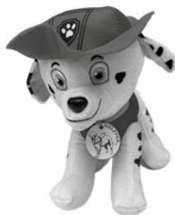
Štěkající patrola (velká)