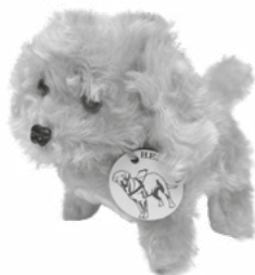
Pes na baterky