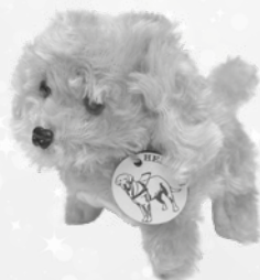
Pes na baterky