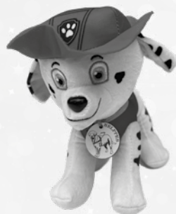
Štěkající patrola (velká)