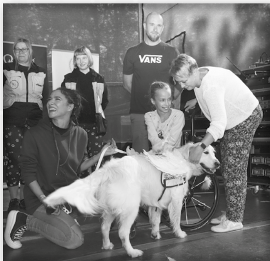
Moc nás těší, že mezi naše příznivce patří i úspěšná herečka a zpěvačka Eva Burešová