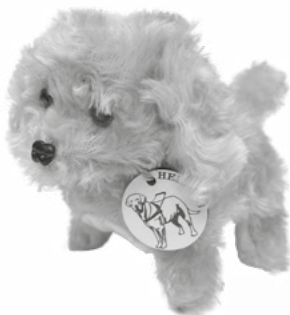
Pes na baterky